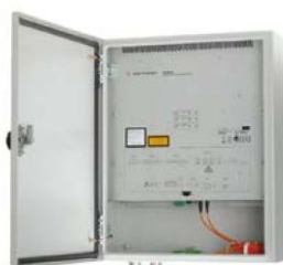
Detektor DTS w wersji ściennej IP66

Najnowszą profesjonalną liniową czujką ciepła wprowadzoną na rynek 2005 r. jest czujka DTS działająca z wykorzystaniem światłowodowego kabla sensorycznego przeznaczona do współpracy z systemem sygnalizacji pożaru Esser by Honeywell. Podstawowym elementem czujki jest detektor DTS dostępny w wersji do montażu w szafie rack 19" w obudowie 2HU lub w wersji w szczelnej obudowie naściennej (IP66). Za pomocą dostarczonego w zestawie z detektorem DTS oprogramowania DTS Configurator dokonuje się konfiguracji detektora, w tym pomiaru długości kabla sensorycznego, jego kalibracji, a następnie definicji stref dozorowanych oraz kryteriów i progów alarmów pożarowych dla każdej strefy indywidualnie. Oprogramowanie DTS Configurator pozwala także na