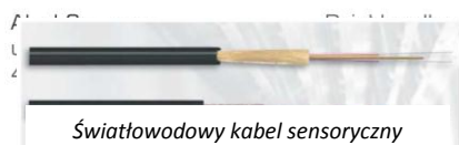
Światłowodowy kabel sensoryczny

Najnowszą profesjonalną liniową czujką ciepła wprowadzoną na rynek 2005 r. jest czujka DTS działająca z wykorzystaniem światłowodowego kabla sensorycznego przeznaczona do współpracy z systemem sygnalizacji pożaru Esser by Honeywell. Podstawowym elementem czujki jest detektor DTS dostępny w wersji do montażu w szafie rack 19" w obudowie 2HU lub w wersji w szczelnej obudowie naściennej (IP66). Za pomocą dostarczonego w zestawie z detektorem DTS oprogramowania DTS Configurator dokonuje się konfiguracji detektora, w tym pomiaru długości kabla sensorycznego, jego kalibracji, a następnie definicji stref dozorowanych oraz kryteriów i progów alarmów pożarowych dla każdej strefy indywidualnie. Oprogramowanie DTS Configurator pozwala także na