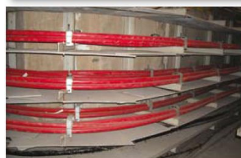
Zastosowanie liniowej czujki ciepła